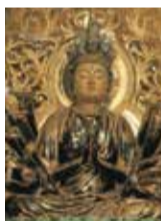
十一面千手観音像

毎年3月2日に東大寺二月堂への「お水送り」が行われるお寺として有名です。東大寺の初代別当、良弁大僧正にまつわる歌の奉納を行います(創作ミュージカル『二月堂良弁杉』より♪南無観、♪下根来の子守唄)。木造本堂は、国の重要文化財に指定されています。